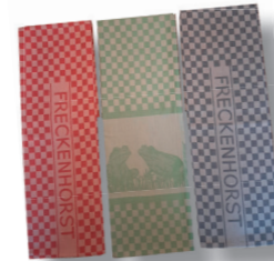
Geschirrtuch 7,00 € (3 Stück) 20,00 €