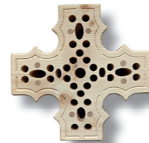
Insektenhotel Freckenhorster Kreuz 20,00 €