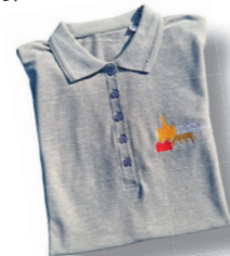
Polo-Shirt 25,00 €