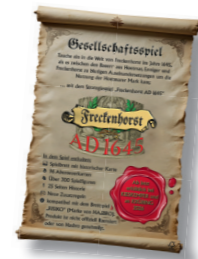
Gesellschaftsspiel 60,00 €