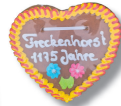
Lebkuchenherz 5,00 €