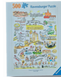
Puzzle 20,00 €