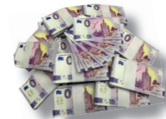
Sammel Schein 3,00 €